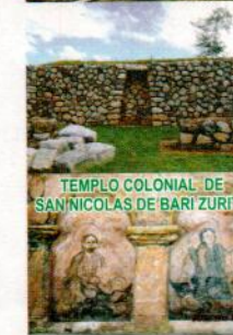
TEMPLO COLONIAL DE SAN NICOLÁS DE BARI ZURITE