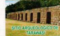
SITIO ARQUEOLÓGICO DE TARAWASI