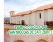
TEMPLO COLONIAL DE SAN NICOLÁS DE BARI-ZURITE