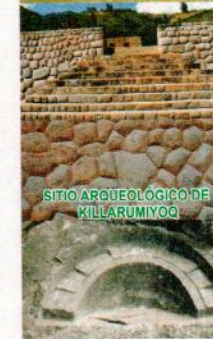
SITIO ARQUEOLÓGICO DE KILLARUMIYOC