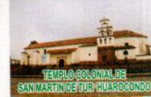
TEMPLO COLONIAL DE SAN MARTÍN DE TUR, HUAROCONDO