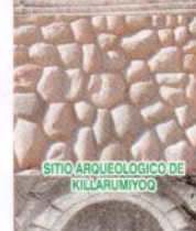
SITIO ARQUEOLÓGICO DE KILLARUMIYOO