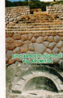
SITIO ARQUEOLÓGICO DE KILLARUMIYOC