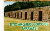
SITIO ARQUEOLÓGICO DE TARAWASI