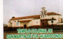
TEMPLO COLONIAL DE SAN MARTÍN DE TUR, HUAROCONDO