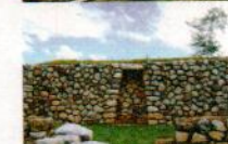
TEMPLO COLONIAL DE SAN NICOLÁS DE BARI ZURITE